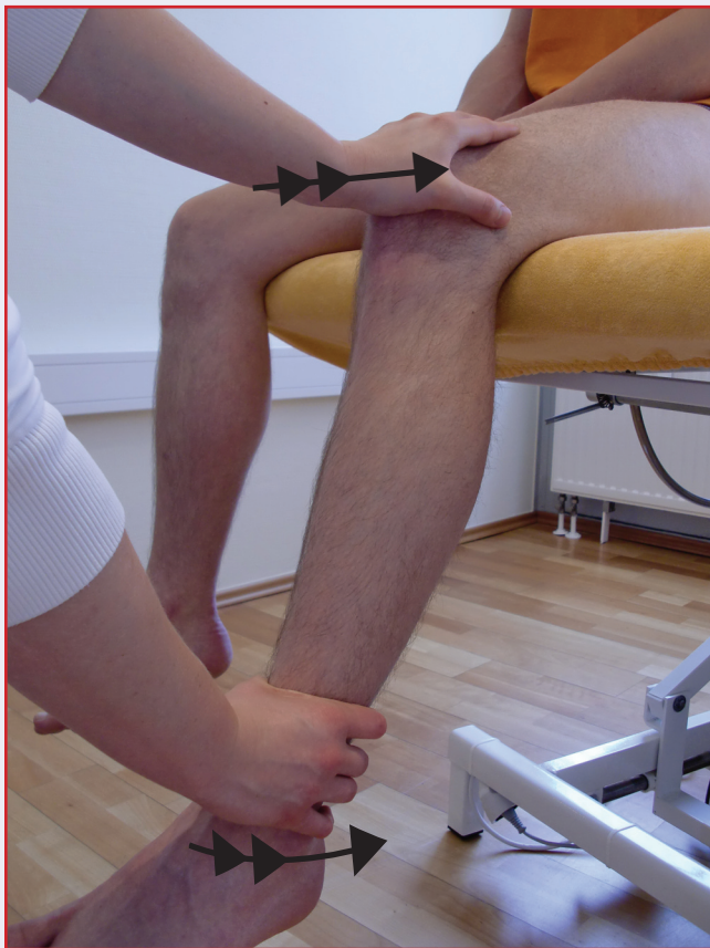
Abb. 3: Anguläre Kompression

gradiger Position durchgeführt werden. Die Mobilisation sollte im Grad II der Kaltenborn-Skala in entgegengesetzter Richtung der Bewegungseinschränkung durchgeführt werden. Hierbei sind die Bewegungen zu kontrollieren, die Handstellungen sind sekundär. Bei der Durchführung der Kompression ist zu beachten, dass das Knie in leichter Flexion auf einer festen Unterlage gelagert ist, damit die evtl. vorhandene Plica nicht komprimiert wird. Mit flächigem Griff erfolgt die Kompression zunächst axial, später mit Mobilisation. Bei der