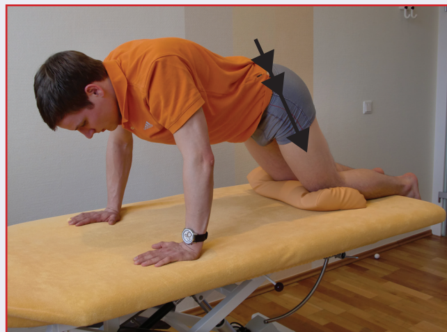
Abb. 5: Aktive anguläre Kompression